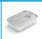
CONTENITORI PRODOTTI ITTICI